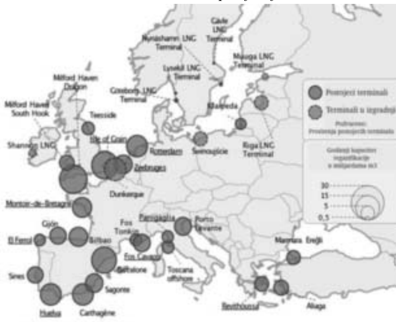
Mapa 1: Postojeći terminali, terminali u konstrukciji i proširenja postojećih terminala u Evropskoj uniji