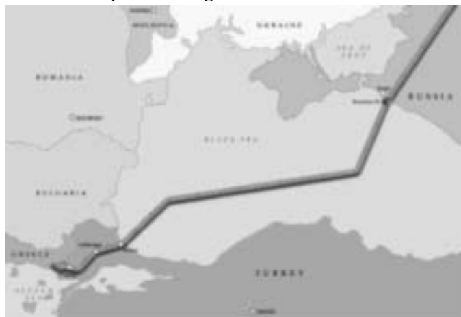
Mapa 2: Ruta gasovoda „Turski tok”