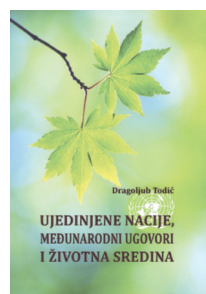
Ujedinjene nacije, međunarodni ugovori i životna sredina, Dragoljub Todić, 2018.