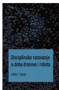
Disciplinsko ratovanje u doba dronova i robota, Srđan T. Korać, 2019.