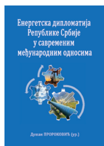
Енергетска дипломатија Републике Србије у савременим међународним односима, Dušan Proroković (ur.), 2019.