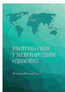
Употреба силе у међународним односима, Žaklina Novčić (ur.), 2018.