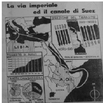
Mapa 1: Carski put i Suecki kanal – Morandijeva mapa objavljena u asopisu Impero Italiano (Italijanska imperija), jul 1938. 22

No, njihov rad počinje nezavisno od te institucije. Roletto je bio francuski đak koji je izabrao Masija, rođenog Tršćanina, za asistenta i zbog odličnog poznavanja nemačkog jezika potrebnog za pravilno razumevanje rada nemačkih političkih geografa i geopolitičara, Haushofera posebno. Roletto već 1928. godine dobija katedru iz ekonomske geografije na univerzitetu u Trstu i 1929. drži predavanje na temu tzv. utilitarne geografije. Roletto i Masi koriste i termin geopolitika, ali do kraja tridesetih godina ostaju mahom pri političkoj geografiji. 23 Sinibaldi, koji nažalost nije nastavio sa geopolitičkim istraživanjima, ukazuje na postepenu evoluciju dvojice ključnih autora od političke geografije ka geopolitici i na Masijevo ukazivanje razlike između nemačkih i italijanskih postavki. 24 Njihov angažman na Fakultetu u Trstu (i drugde) bitan je zbog simbolike pograničnog grada okruženog slovenskim stanovništvom, koji predstavlja branu ili isturen položaj ka severoistočnom Jadranu. Trst je i danas zajedno sa Goricijom jedan od najvažnijih centara za izučavanje geopolitike i geostrategije u Italiji.