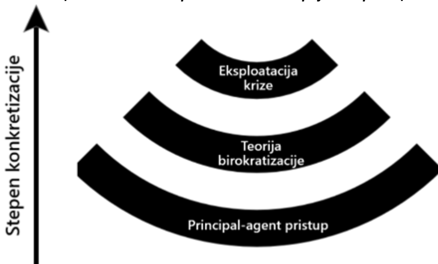
Скица 1. Шематски приказ односа теоријских праваца